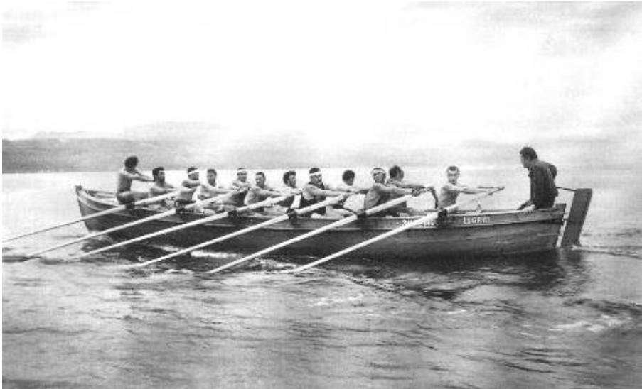
Lugrin, l'équipe de rame 1996