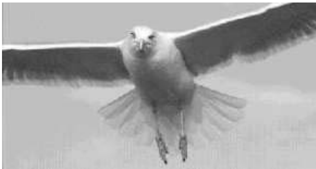
Goeland leucophée adulte

Ce magnifique ouvrage vous fera certainement rêver devant ces merveilles de la nature, prises au piège de la pellicule, dans leur environnement, par des couleurs, des reflets et des situations inhabituelles, parfois majestueuses.