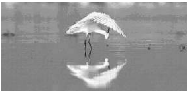
Toilette de l'aigrette garzette

Ce magnifique ouvrage vous fera certainement rêver devant ces merveilles de la nature, prises au piège de la pellicule, dans leur environnement, par des couleurs, des reflets et des situations inhabituelles, parfois majestueuses.