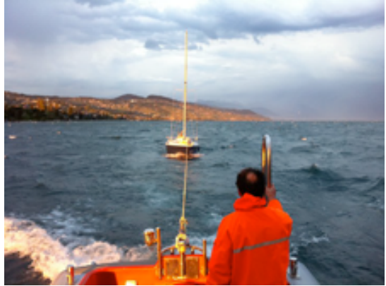
Intervention du 19.05.2011, voilier en panne de moteur

C'est dans ce cadre agréable que les membres de la section de Pully travaillent à préserver les traditions, à conserver les embarcations et à les maintenir en bon état, tout en assurant la surveillance du lac.